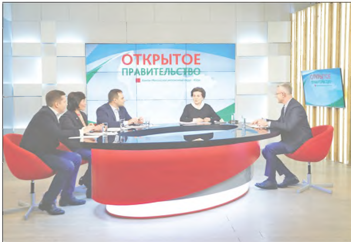
Вопросы губернатору задавали главные редакторы региональных СМИ - ОТРК “Югра”, ГТРК “Югория”, газеты “Новости Югры”, объединенной редакции газет “Ханты ясанг” и “Луума сэрипос”.

Полагаю, в отношении объемов добычи есть другие возможности, кроме энергетики, использования этих ценных ресурсов, и мы должны думать и в том числе о них. Поддержку инновационную составляющую. Когда я встречаюсь с молодыми учеными, то подчёркиваю: сочиняете, мыслите креативно, находите возможности, чтобы наше основное богатство - сырьё - можно было использовать в самых разных, неожиданных ракурсах. На сегодняшний день это основной источник формирования доходной базы, богатства региона и Российской Федерации. Если к этому относиться таким образом, то нужно учитывать все тенденции рынка энергетики, способы формирования энергоносителей, важно искать другие направления, создавать новые точки роста, чтобы это время диверсификации, замещения использовать максимально. Но какие-то возможности мы уже пропустили. Я не имею в виду наш регион,