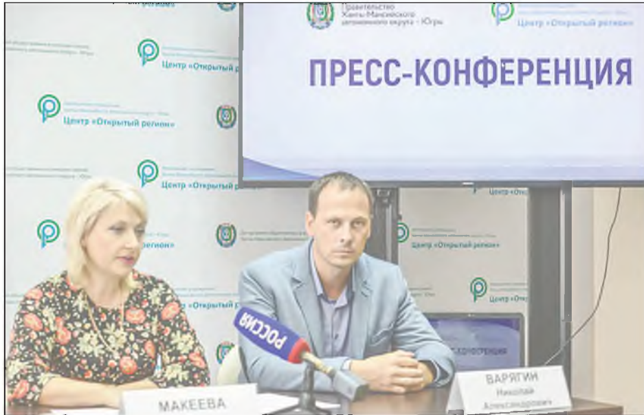
Именно такие слова можно сказать о церемониях определения победителей-обладателей ценных подарков историко-краеведческой викторины "Города Югры". Они состоялись в 15 городах автономного округа 15 и 16 сентября.