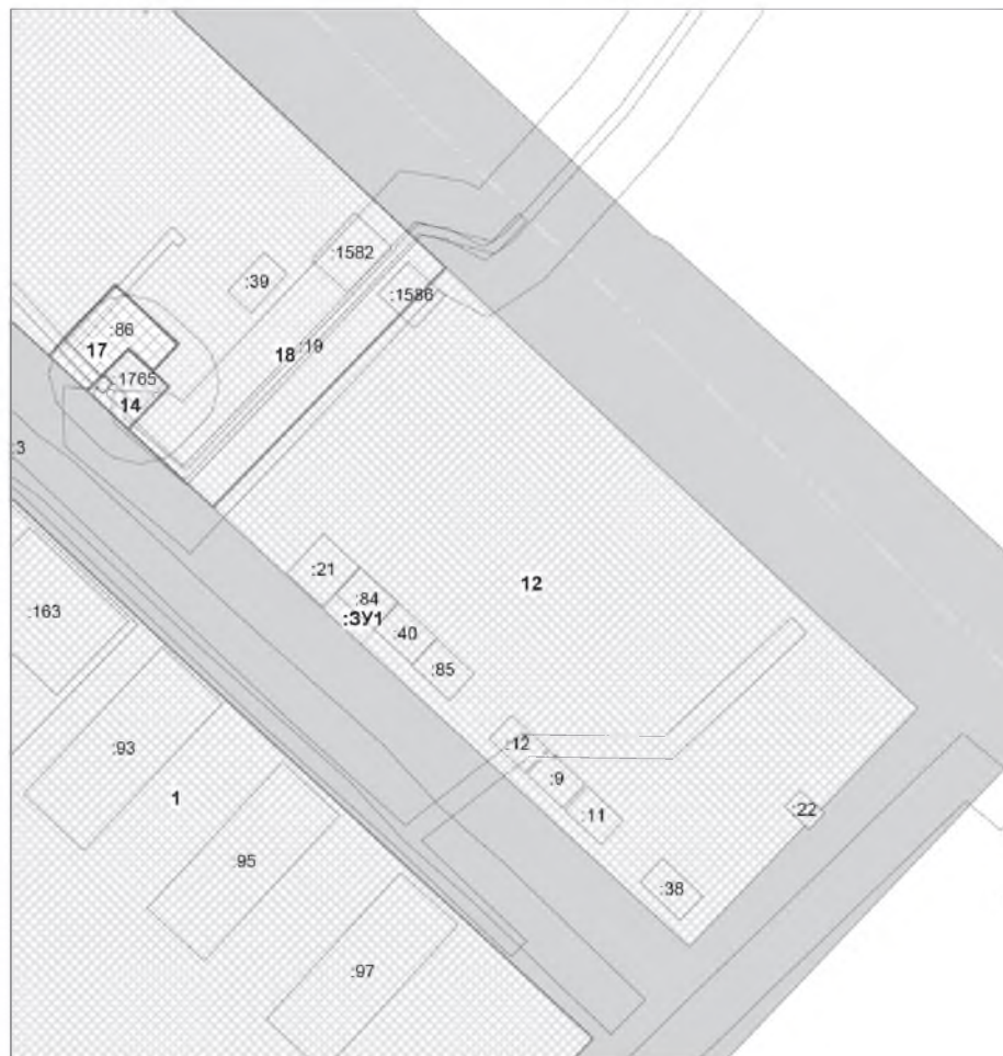
ПРОЕКТ ВНЕСЕНИЯ ИЗМЕНЕНИЙ В ПРОЕКТ МЕЖЕВАНИЯ ТЕРРИТОРИИ 8 МИКРОРАЙОНА ГОРОДА МЕГИОНА ЧЕРТЕЖ МЕЖЕВАНИЯ ТЕРРИТОРИИ М1:1000