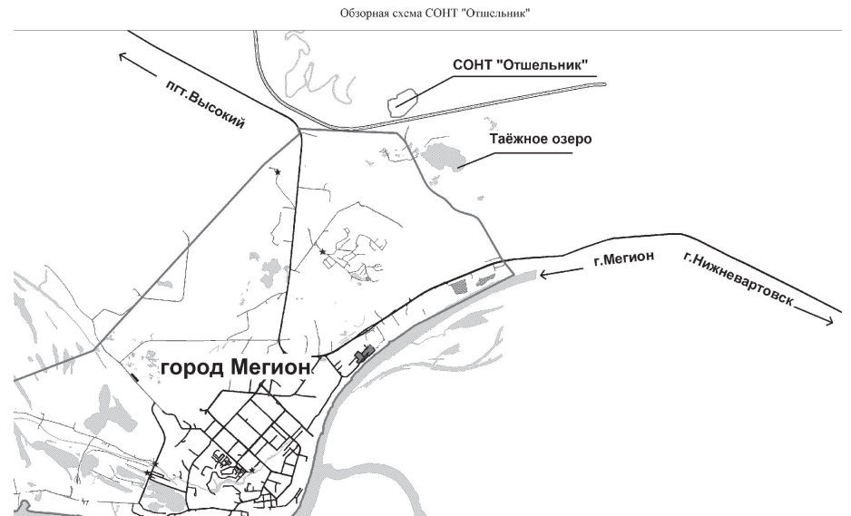
Приложение 2 к постановлению администрации города от 13.04.2018 г. №715