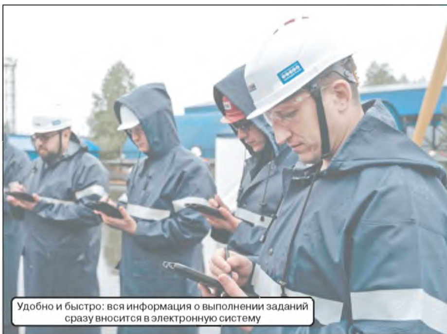
Удобно и быстро: вся информация о выполнении заданий сразу вносится в электронную систему

развитию массового и профессионального спорта, регулярно выделяя средства на проведение крупных турниров и соревнований. В 2017 году в "Славнефть-Мегионнефтегазе" был дан старт волонтерскому движению. Сегодня его активными участниками являются свыше полусотни человек. За время действия проекта волонтеры провели десятки акций, направленных на профессиональную ориентацию школьников, пропаганду здорового образа жизни, оказание помощи социально незащищенным категориям населения, а также сохранение культурного и духовного наследия.