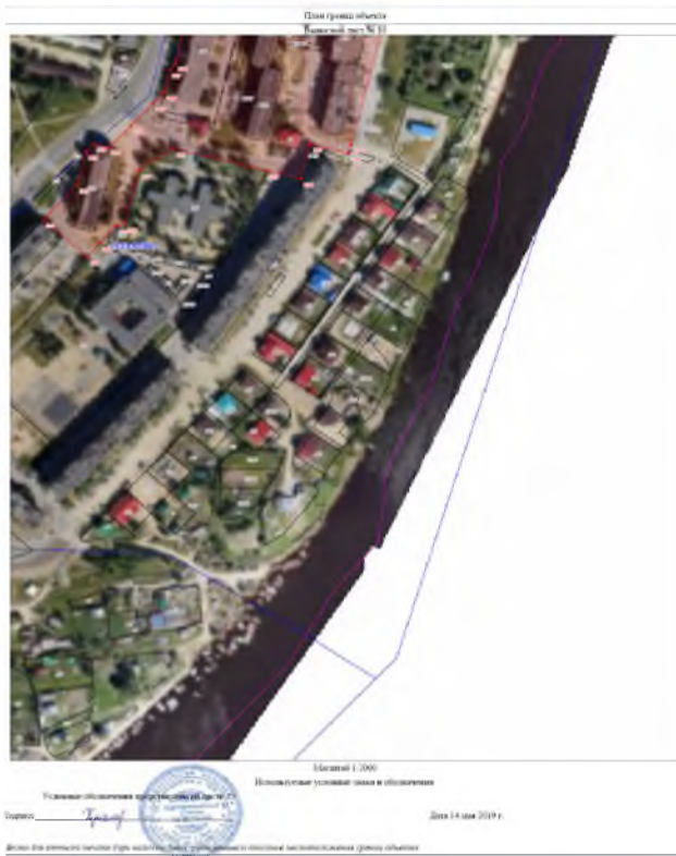
План границ участка Квартал № 36/1 Исполнитель: ООО «ЭФОР МЕДИА» Исполнитель: ООО «ЭФОР МЕДИА» Дата: 14 мая 2019 г.

О ПРАВИЛАХ ЗЕМЛЕПОЛЬЗОВАНИЯ И ЗАСТРОЙКИ ГОРОДСКОГО ОКРУГА ГОРОДА МЕГИОН