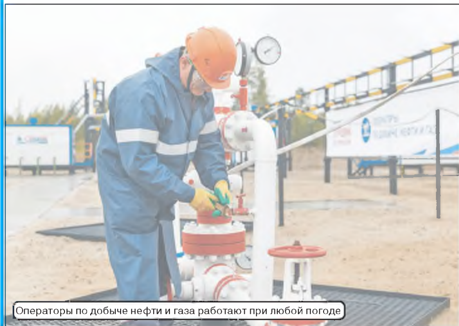
Операторы по добыче нефти и газа работают при любой погоде