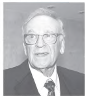
«КАРМАННЫЙ ДОКТОР» вернул меня к жизни!

Счастье - это быть здоровым. Вы согласны? Ибо без здоровья нет, сил радоваться жизни. И даже для счастья в личной и семейной жизни и успеха в работе нам непременно нужно здоровье! Как обрести его, знают те, у кого есть «КАРМАННЫЙ ДОКТОР», творящий настоящее волшебство!